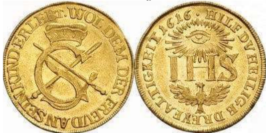
Sphiendukaten 1616, Dresden. Verschlungenes SC (=Sophia, Churfürstin) auf gekreuztem Schwert und Zepter. Rückseite: Darstellung der göttlichen Dreieinigkeit durch das Auge Gottes, Christusmonogramm und Heiliggeisttaube. Gold / ca. 24 mm / ca. 3,4 Gramm (auch als seltene Silberabschläge im Gewicht eines viertel Talers bekannt.)

Sophiendukaten, Kinderdukaten, Dreifaltigkeitsdukaten , Anfang 17. Jh. im Auftrag der Kurfürstin Sophie von Sachsen geprägte Goldmünze. Sophie ließ den „Sophiendukaten“ zu Weihnachten 1616 zu Ehren ihrer Kinder prägen, zu denen auch Kurfürst Johann Georg I. (reg. 1611-1656) zählte. Das Geschenk der Kurfürstin-Mutter wurde, wegen seiner Beliebtheit als Patengeschenk, auch Kinderdukaten genannt. Zurückzuführen ist diese Vorliebe auf die am Avers befindliche Umschrift: „Wol dem der Freud an seinen Kind erlebt“. Am Revers befinden sich die Symbole und die Umschrift: „Hilf du heilige Dreyfaltigkeit 1616“. Die Münze erfreute sich als Patengeschenk so großer Beliebtheit, dass sie bis 1872 mit motivgleichem Stempel in der Dresdener Münze weitergeprägt und auf Rechnung des Münzmeisters um 3½ Taler verkauft wurde. Der „Sophiendukaten“ wurde, wie alle Dukaten, durch das Reichsgesetz vom 6. Dez. 1873 im Deutschen Reich außer Kurs gesetzt.